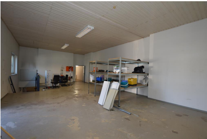
Treppe ins UG