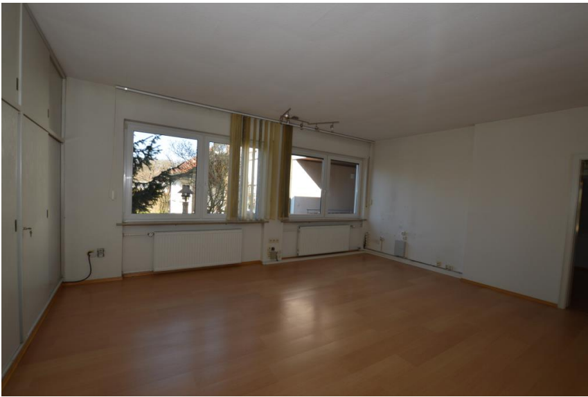
Verbundenes Büro 1