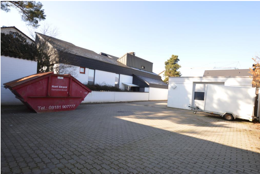
Freifläche zum Parken