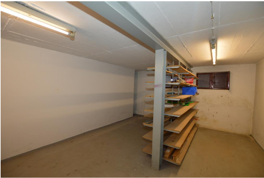
Lager im UG 2