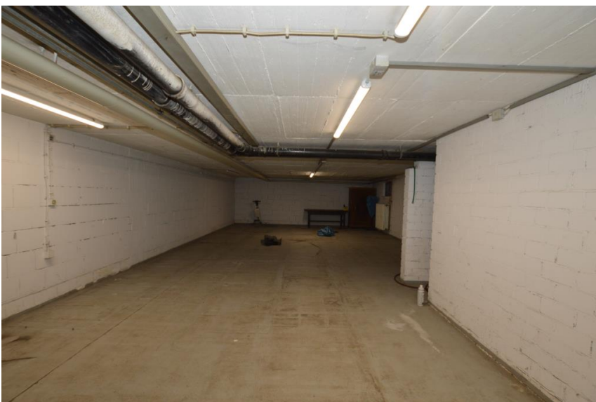
Lager im UG 1