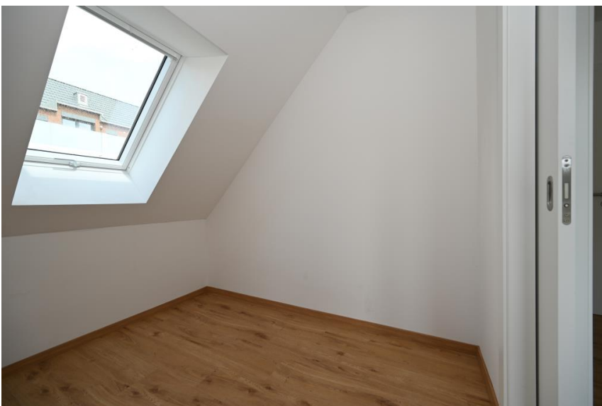
... eigener Ankleide