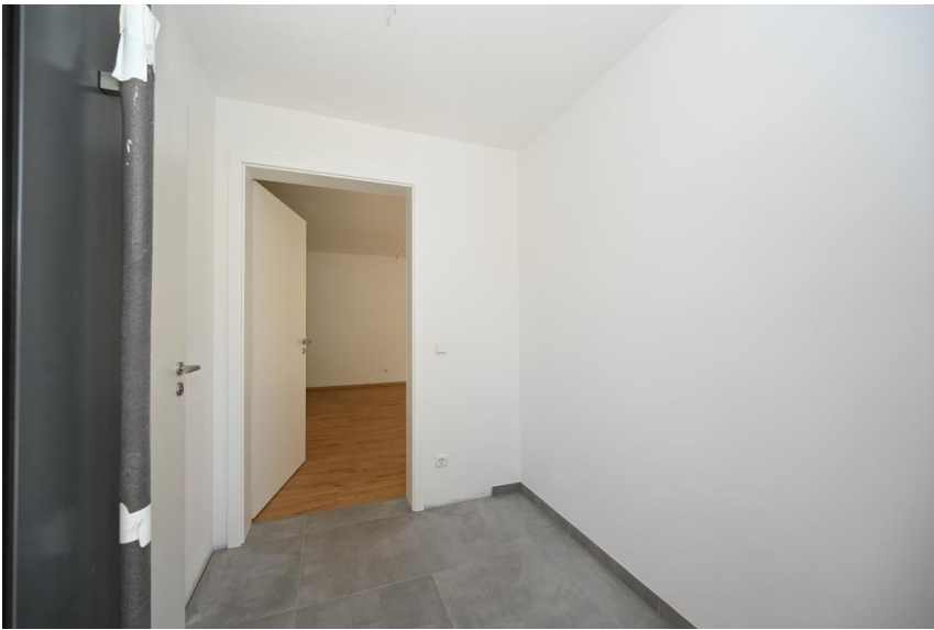
Windfang und Garderobe