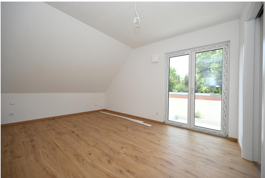
Schlafzimmer mit ...