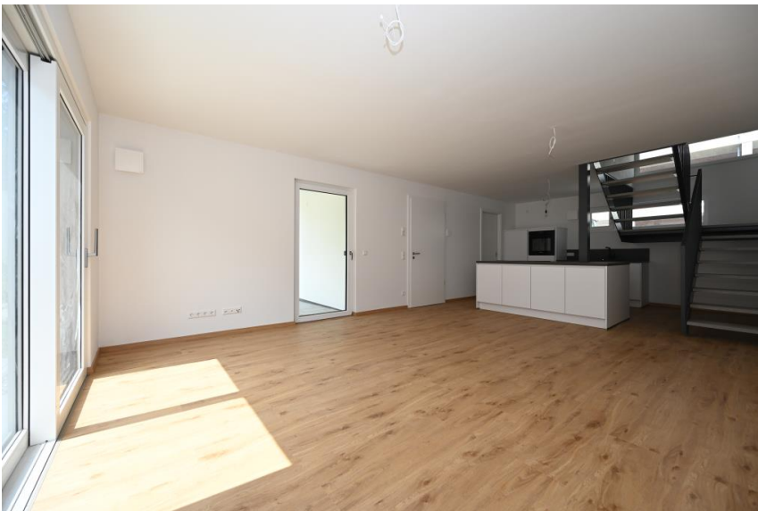
Geräumig und hell