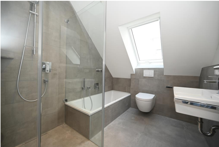
Voll ausgestattetes Bad