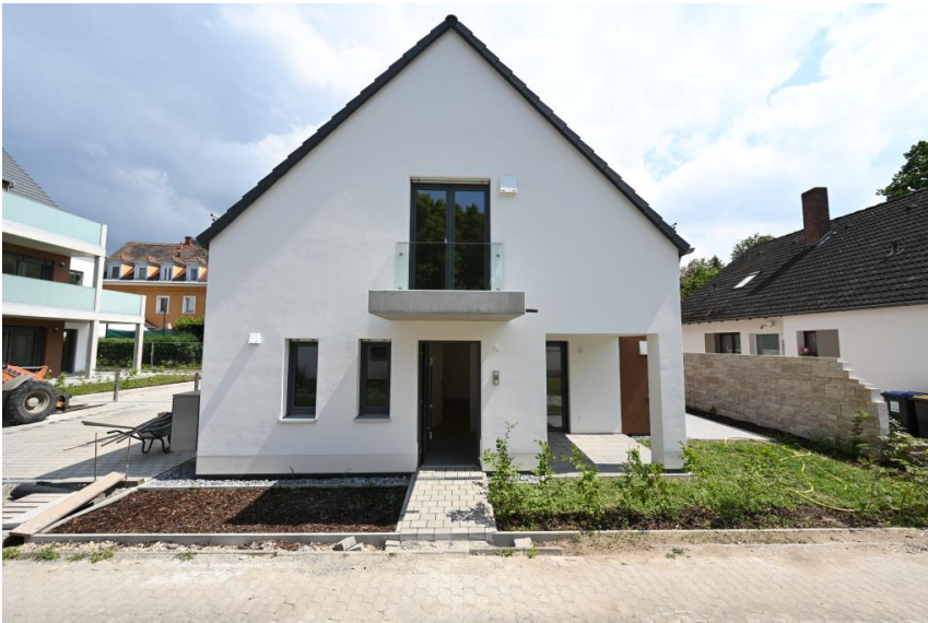
Sehr ruhig gelegen