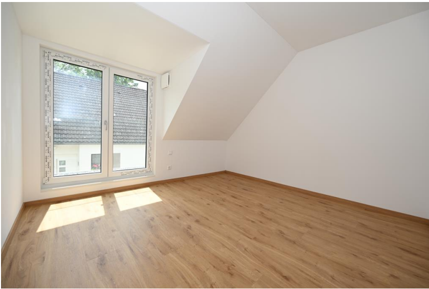
Kind / Büro / Gäste