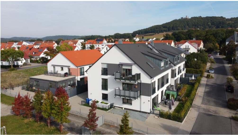
Ruhige, sonnige Lage