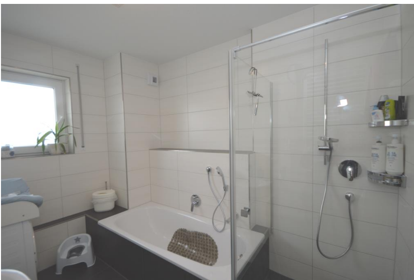
Bad in Vollausstattung