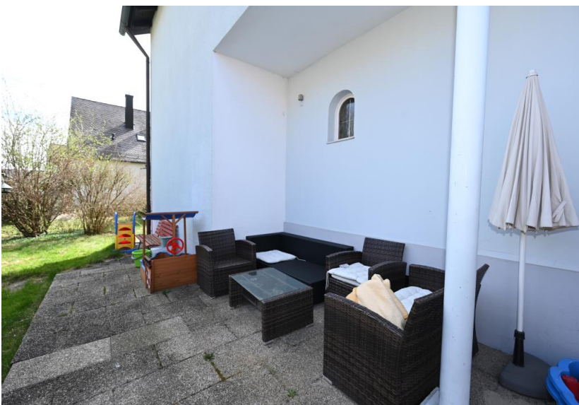
Freisitz im Erdgeschoss