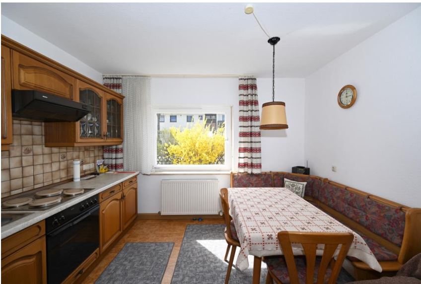
Platz für Esstisch