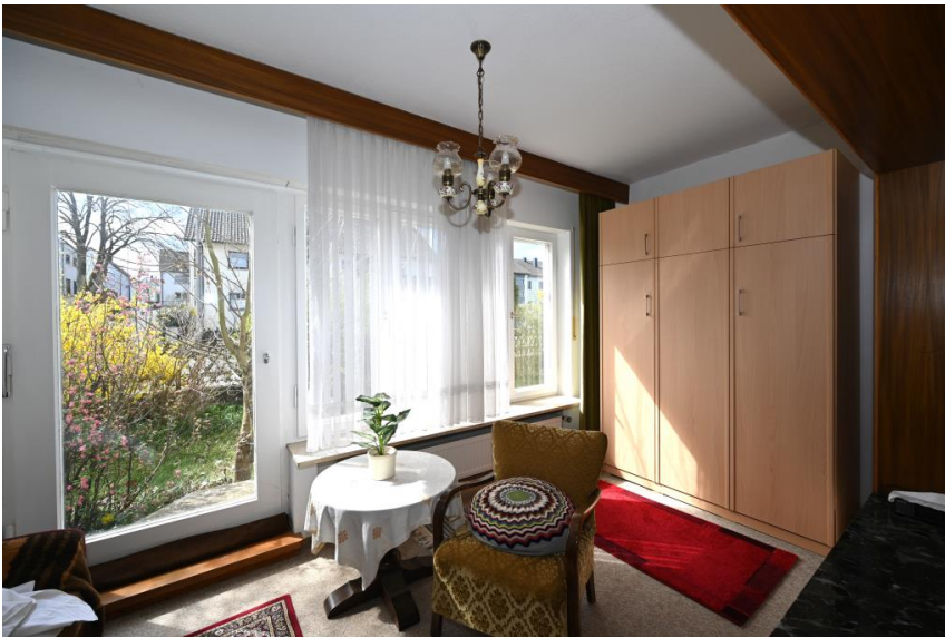
Hell + freundlich