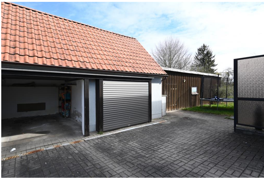
2 Garagen + Holzlege