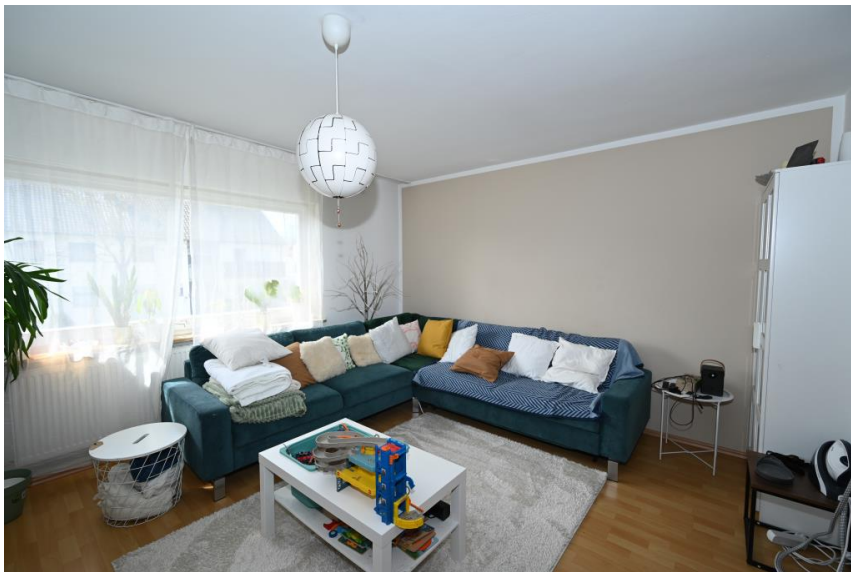
Wohnen 1. Obergeschoss