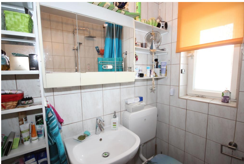
Tageslichtbad + Wanne