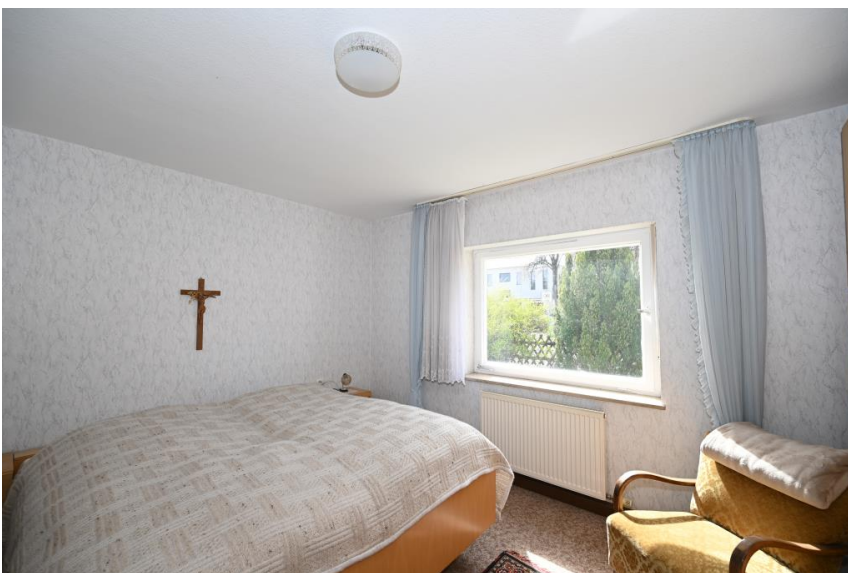
Schlafen in schöner Größe