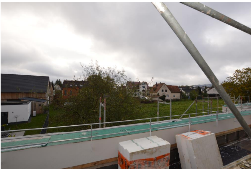
Highlight - die Dachterasse